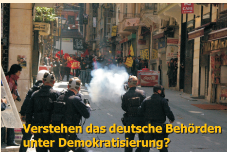
Verstehen das deutsche Behörden unter Demokratisierung?

Die Türkei ist nach wie vor ein Folterstaat, der seine kurdische Bevölkerung grausam unterdrückt. Am kurdischen Newroz-Fest vor wenigen Wochen erschoss die türkische Polizei 4 Menschen, verletzte hunderte weitere und nahm mehr als 2.000 Menschen fest. Die Verwendung der kurdischen Sprache in der Politik ist weiterhin verboten. Regelmäßig werden kurdische PolitikerInnen deswegen zu Haftstrafen verurteilt. Radio- und TV-Sendungen auf Kurdisch sind nur wenige Stunden pro Woche erlaubt – und nur unter Staats-Aufsicht. Der türkische Menschenrechtsverein IHD und Human Rights Watch belegen, dass türkische Sicherheitskräfte wieder verstärkt Folter anwenden, ihre Opfer sind in erster Linie politisch aktive Kurdinnen und Kurden. Gegen die ins Parlament gewählte pro-kurdische DTP läuft ein Verbotsverfahren. Türkische Kampffjets bombardieren kurdische Dörfer und Stützpunkte der kurdischen Guerrilla im Nordirak. Die kurdische Befreiungsbewegung bietet seit Jahren einseitig die Hand zum Frieden, startete einen Waffenstillstand nach dem anderen – doch die Antwort der Türkei ist immer nur Krieg, Terror und Vernichtung – EU-Beitrittsverhandlungen hin oder her.