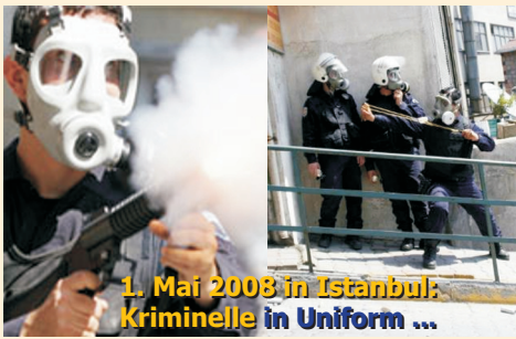
1. Mai 2008 in Istanbul: Kriminelle in Uniform ...