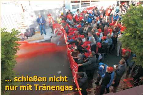
... schießen nicht nur mit Tränengas ...