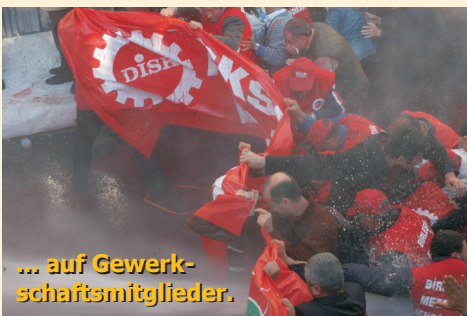
... auf Gewerk- schaftsmitglieder.