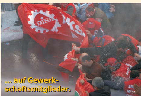
... auf Gewerk- schaftsmitglieder.