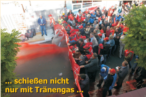
... schießen nicht nur mit Tränengas ...