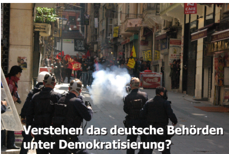
Verstehen das deutsche Behörden unter Demokratisierung?

Die Türkei ist nach wie vor ein Folterstaat, der seine kurdische Bevölkerung grausam unterdrückt. Am kurdischen Newroz-Fest vor wenigen Wochen erschoss die türkische Polizei 4 Menschen, verletzte hunderte weitere und nahm mehr als 2.000 Menschen fest. Die Verwendung der kurdischen Sprache in der Politik ist weiterhin verboten. Regelmäßig werden kurdische PolitikerInnen deswegen zu Haftstrafen verurteilt. Radio- und TV-Sendungen auf Kurdisch sind nur wenige Stunden pro Woche erlaubt – und nur unter Staats-Aufsicht. Der türkische Menschenrechtsverein IHD und Human Rights Watch belegen, dass türkische Sicherheitskräfte wieder verstärkt Folter anwenden, ihre Opfer sind in erster Linie politisch aktive Kurdinnen und Kurden. Gegen die ins Parlament gewählte pro-kurdische DTP läuft ein Verbotsverfahren. Türkische Kampffjets bombardieren kurdische Dörfer und Stützpunkte der kurdischen Guerrilla im Nordirak. Die kurdische Befreiungsbewegung bietet seit Jahren einseitig die Hand zum Frieden, startete einen Waffenstillstand nach dem anderen – doch die Antwort der Türkei ist immer nur Krieg, Terror und Vernichtung – EU-Beitrittsverhandlungen hin oder her.