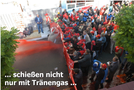
... schießen nicht nur mit Tränengas ...