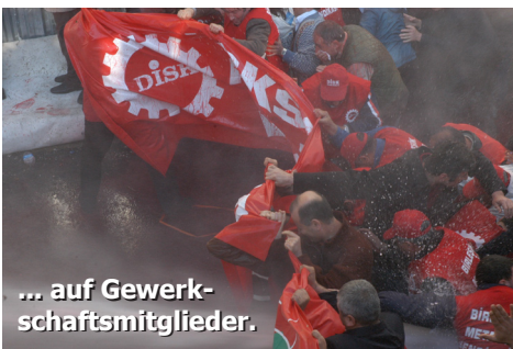
... auf Gewerk- schaftsmitglieder.