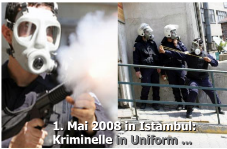
1. Mai 2008 in Istanbul: Kriminelle in Uniform ...